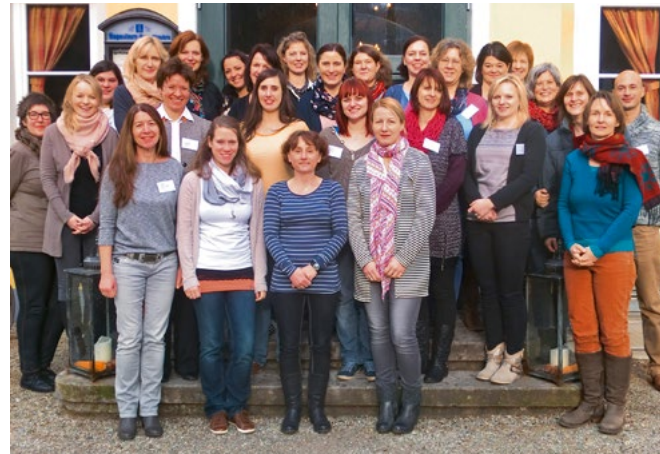
Auftakt in Landshut zur Qualifizierung von Fachkräften aus dem Gesundheitswesen mit Koki-Fachkräften

Sechs Jahre Erfahrung haben gezeigt, dass sich nur ein geringer Anteil der unterstützten Familien im Transferleistungsbezug nach SGB II und XII befindet. Eine aktuelle Befragung bei den bayerischen Jugendämtern macht deutlich, dass die Probleme, mit denen sich Familien an die KoKis wenden, vielfältig sind: Trennung/Scheidung bzw. Partnerschaftskonflikte gehören dazu, ebenso wie Frühgeburt, (chronische) Krankheit oder Behinderung des Kindes, Mehrlinge, Drogen/Suchterkrankung eines Elternteils. Auch sehr junge Eltern, Alleinerziehende und asylsuchende Familien suchen die Stellen auf. Besonders häufig wurde als Grund auch die psychische Belastung der